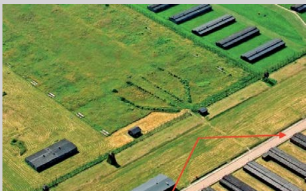
«Лагерьштрассе» и административно-хозяйственные постройки (склады и мастерские). Государственный музей в Майданеке

В 1999 г. в бараке № 47 была открыта мультимедийная экспозиция. Вашему вниманию представлена художественная инсталляция Тадеуша Мысловского «Святылище — памятник неизвестной жертве». Экспозиция включает символическую композицию из шаров колючей проволоки, мемориальную книгу, ораторию, воспоминания узников и молитвы поляков, евреев, русских и цыган.