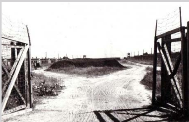
Междуполье II. Государственный музей в Майданеке