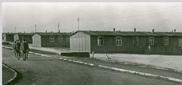
Баракки административного сектора. Государственный музей в Майданеке

Карл Отто Кох (с сентября 1941 г.) , прославившийся чрезвычайной жестокостью на должности коменданта лагеря Бухенвальд, около Веймара. Макс Кёгель (август—сентябрь 1942 г.) был откомандирован из Равенсбрюка. Герман Флёрштедт (ноябрь 1942 — октябрь 1943) до перевода в Майданек служил в должности начальника канцелярии в Заксенхаузене, где безжалостно наказывал заключённых за малейшую провинность. Мартин Вайсс (ноябрь 1943 — май 1944) переведен в Майданек из лагеря в Дахау. Последним комендантом лагеря был назначен Артур Либенхешель (май 1944—22.07.1944), ранее служивший на той же должности в Аушвице. Необходимо отметить, что все коменданты, возглавлявшие Майданек, были переведены туда в качестве дисциплинарного наказания за те или иные нарушения. Так, Карл Отто Кох был «выслан» на Восток за финансовые махинации и несанкционированные расстрелы заключённых в Бухенвальде, а Артур Либенхешель за супружескую неверность.