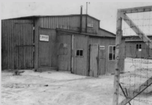
Поле для заключенных III. Государственный музей в Майданеке

Леонард Стацевич из Новой Вилейки (8 августа — 27 августа 1944)