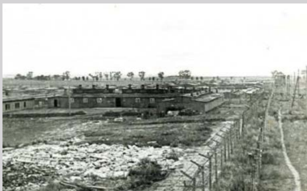
Поле V. Государственный музей в Майданеке

Ромуальд Штраба , врач из Сосновца, политическая заключённая (18 февраля 1943—7 апреля 1944)