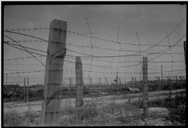
Ряды колючей проволоки вокруг лагеря и между полями.