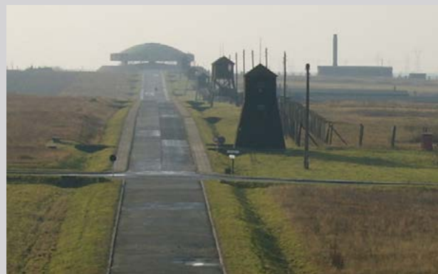
Памятник Борьбе и Мученичеству. На фото представлены Мавзолей и Дорога памяти. Государственный музей в Майданеке

В 1962 году на месте массового расстрела еврейских узников 3 ноября 1943 года была установлена гранитная плита работы скульптора Станислава Стшижиньского. В 2003 году её заменил новый памятник из песчаника с гранитной плитой в форме мацевы (еврейского надгробия), созданный скульптором Казимежем Сташем.