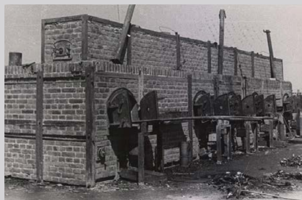
Печи крематория после освобождения лагеря.