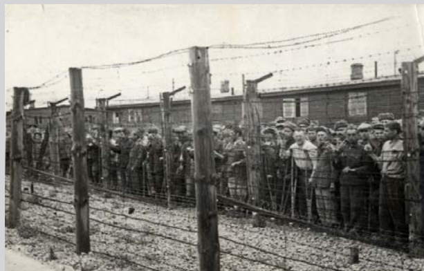
Заклученные Майданека, освобожденные Красной Армией. ФГБУК «Государственный центральный музей современной истории России». 37553/1349.