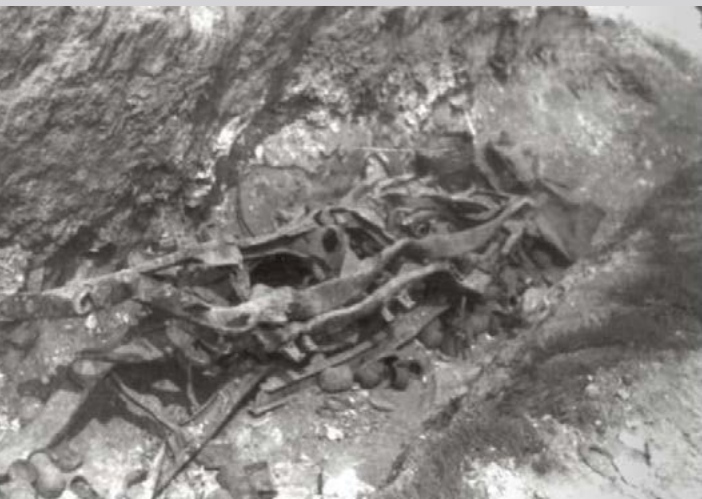
Человеческие останки, обнаруженные на месте расстрелов. Государственный музей в Майданеке