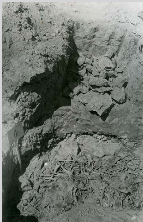
Яма с костями и пеплом сожженных узников, обнаруженная на территории лагеря. ФГБУК «Государственный центральный музей современной истории России». 31512/137

расстреливают их из автоматов. Если автобус привозит лишь несколько человек, их ведут в крематорий и убивают в помещении, где лежат трупы, ожидающие своей очереди в печах. Наша разведка подтверждает, что в автобусах обычно перевозят заключённых из Люблинского замка, но бываюи и случаи, когда привозят людей из деревень, где был застрелен тот или иной немец.