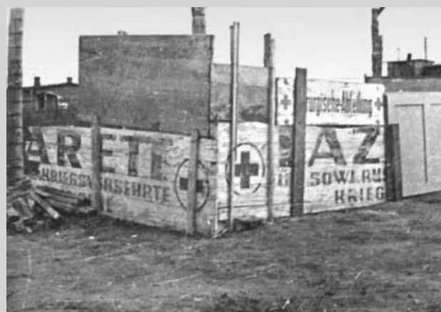
Поле заключенных II, служившее в качестве лазарета для раненных советских военнопленных. Государственный музей в Майданеке