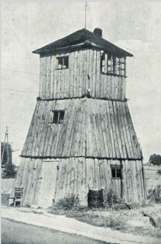
Сторожевая вышка.