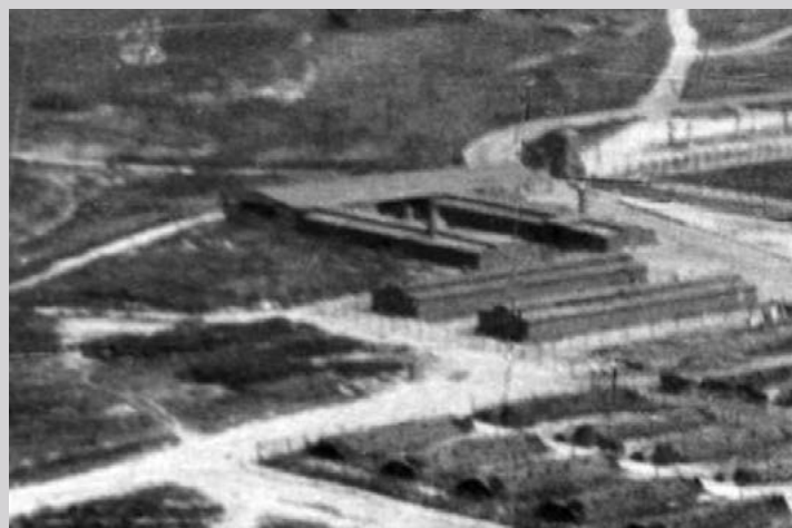
Площадь для селекций. Государственный музей в Майданеке

Ежи Квятковский , юрист из Варшавы, политический заключённый (26 марта 1943–22 июля 1944)