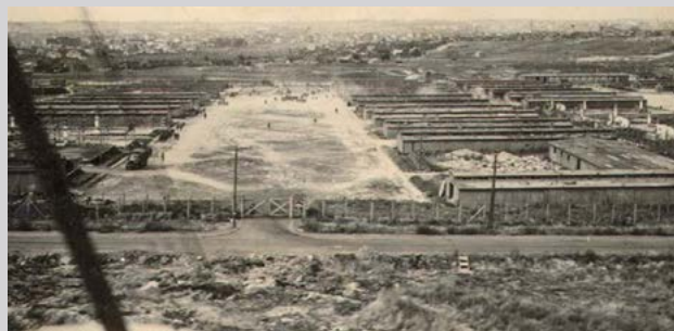
Поле для заключенных IV. Государственный музей в Майданек

Евгениуш Нехада , бывший житель деревни Ямы близ Осипова Любельского, заложник (20 июня — 3 сентября 1943).