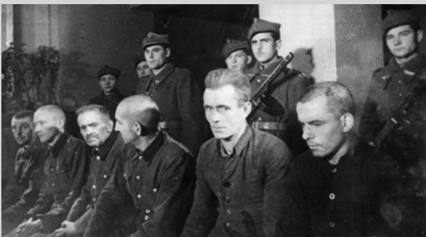
Бывшие сотрудники концлагеря на скамье подсудимых. Marszałek J. Majdanek. Obóz koncentracyjny w Lublinie.

Из-за отсутствия полных архивных данных невозможно точно определить общее количество жертв Майданека. Сохранившиеся фрагментарные записи из лагерной администрации, доклады подпольных групп сопротивления внутри лагеря и свидетельства очевидцев позволяют оценить число жертв примерно в 80 000 человек. Среди них больше всего погибших или убитых — евреи (около 60 000), за ними следуют поляки, белорусы, украинцы и русские.