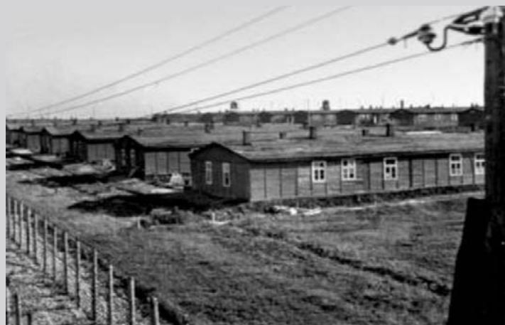
Вид на поле заключенных I. Государственный музей в Майданеке

Стефания Перзановская , врач из Радома, политическая заключённая (8 января 1943—15 апреля 1944)