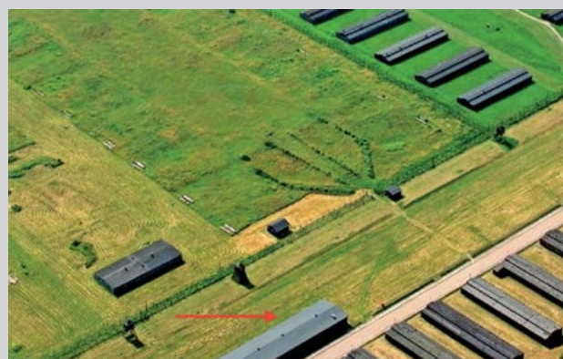
«Лагерштрассе» и сапожная мастерская (отмечена стрелкой). Государственный музей в Майданеке

В настоящее время в блоке № 62 располагается историческая экспозиция «Заключенные Майданека».