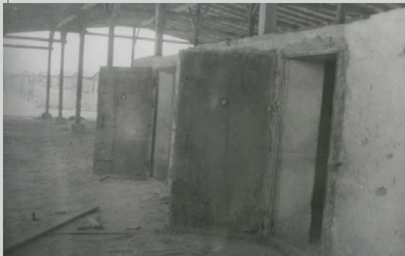
Газовые камеры. ФГБУК «Государственный центральный музей современной истории России». ГЦМСИР ГИК 31512/124

Роттенфюрер СС Отто Хеншке , руководитель швейной мастерской (15 июля 1942—22 июля 1944)