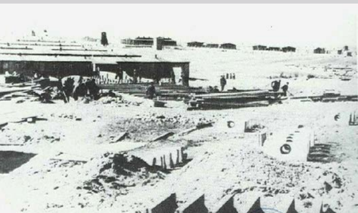
Лагерные склады и мастерские в период строительства. Государственный музей в Майданеке

довольственные склады, а в следующих — склады одежды (48, 49, 50) и склады оборудования и инструментов (51, 52). Бараки № 43 и 44 использовались в качестве складов для хранения имущества заключенных (Effektenkammer). Барак № 43 также служил пунктом приема и регистрации вновь прибывших заключенных. Администрация концлагеря также организовала здесь ювелирную мастерскую, где сортировали драгоценности, украденные у депортированных в лагерь евреев.