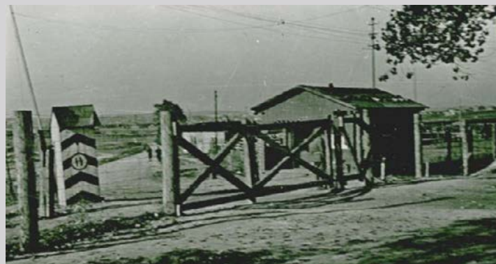
Входные ворота в лагерь с постом охраны. Государственный музей в Майданеке.

Изначально лагерь в Люблине был создан как лагерь для военнопленных, но 16 февраля 1943 года он стал концентрационным лагерем — Konzentrationslager der Waffen-SS (KL Lublin). Из-за близости к району Майдан Татарски лагерь получил название Майданек.