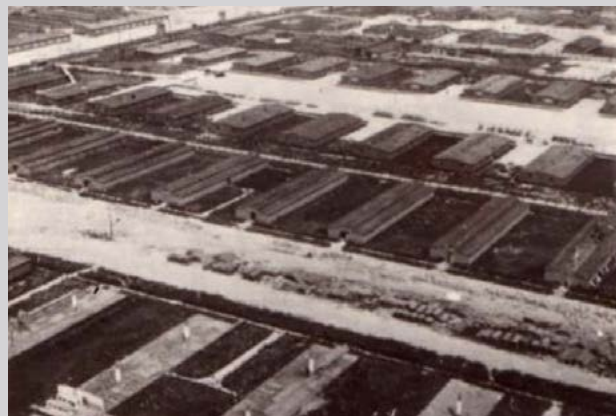
Вид на лагерь. Аэрофотосъемка. Государственный музей в Майданеке.

200 метров табличками на немецком и польском языках с предупреждением, что проникновение в лагерь без разрешения карается расстрелом. Они указывали путь к “Офису коменданта лагеря”. На каждой табличке был изображён череп с костями [...] Мы приближались к лагерным воротам. Они распахнулись. Мы вошли в лагерь под крики».