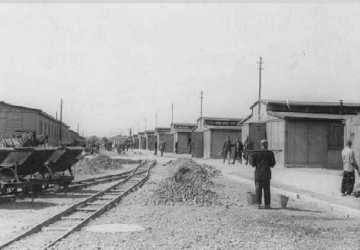
Склады личных вещей узников. Государственный музей в Майданеке