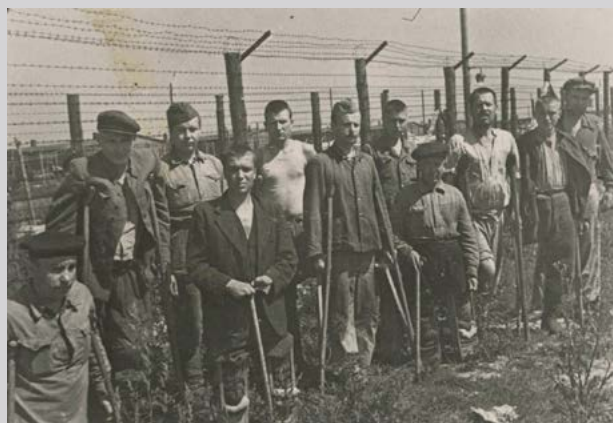
Заклученные, освобожденные Красной Армией. ГБУК и ДО г. Москвы «Мультимедийный комплекс актуальных искусств». Инв. № Ф11-19434.